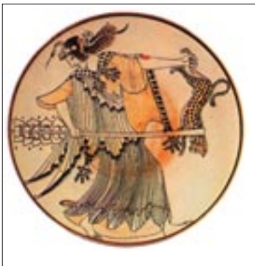
Μαινάδα, αγγείο, 490 π.Χ.

■ Μελετώντας το Στάσιμο αυτό προκύπτει ένα ακόμα ερώτημα: είναι το Στάσιμο εμβόλιμο ή συνδέεται, έστω και έμμεσα, με το δράμα; Σε αυτό μας τον προβληματισμό θα βοηθήσει και η απάντηση στα παρακάτω ερωτήματα: