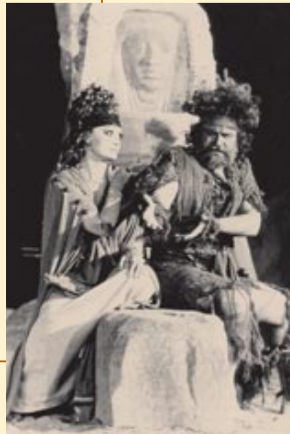
Ελένη – Μενέλαος (Α. Λαδικού – Δ. Καρέλλης, Κ.Θ.Β.Ε., 1982, σκην. Α. Βουτσινάς)