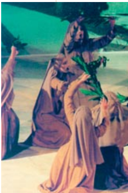
Χορός σε σύγχρονη παράσταση (Αμφιθέατρο)