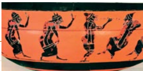
Απική μελανόμορφη κύλικα του 6ου αι. π.Χ. με παράσταση τραγικού Χορού