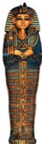
Σαρκοφάγος, τάφος του Τουταγχαμών

Π. Η. Μ. Κουσουλής, Θάνατος και Ταρίχευση στην Αρχαία Αίγυπτο, Αρχέτυπο