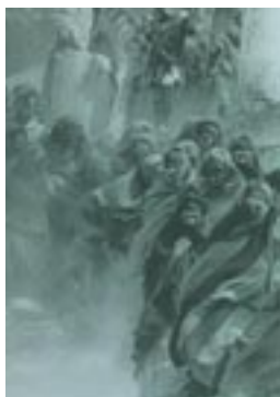
Από την κινηματογραφική ταινία Τρωάδες (σκην. Μ. Κακογιάννης)