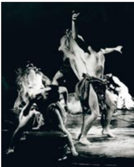
Χορός (Α. Σακελλαρίου – Κ. Ταχισόγλου, Ευριπίδης, Βάκχες, Άπρις, 1987, σκην. Θ. Τερζόπουλος)

■ Ας θυμηθούμε την προέλευση της τραγωδίας. Η αρχή της εντοπίζεται στις συμβολικές τελετουργικές πράξεις, με τις οποίες οι πιστοί λάτρευαν το Διόνυσο.