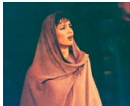
Ανιγόνη (Κ. Καραμπέτη, Σοφοκλής, Ανιγόνη, Εθν. Θέατρο, 1995, σκην. Μ. Βολανάκης)