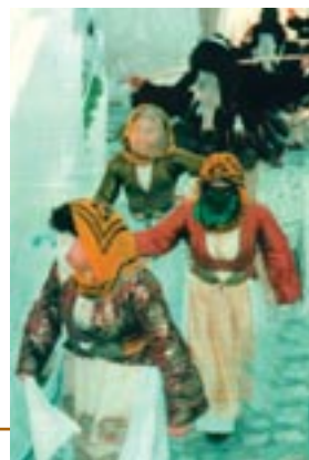
Από καρναβαλικές γιορτές στη Σκύρο

(Από το Γ. Α. Μέγας, Ελληνικές γιορτές και έθιμα της λαϊκής λατρείας , Οδυσσέας)