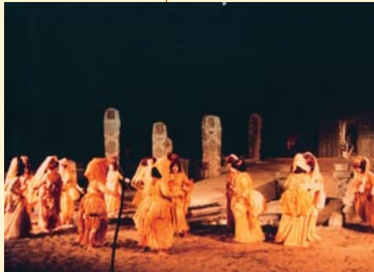
Χορός της Ελένης (Κ.Θ.Β.Ε., 1982, σκην. Α. Βουτινιάς, χορογρ. Ε. Πίττα)