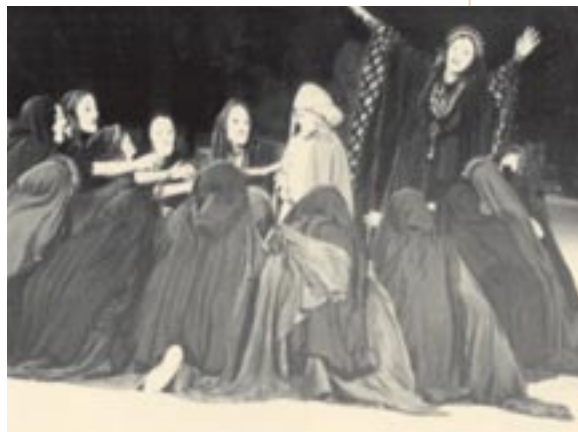
Χορός (Ευριπίδης, Τρωάδες, Εθνικό θέατρο, 1983, σκην. Σ. Ντουφεξής, κίνηση Ν. Ζούκα)