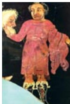
Θραύσμα αγγείου με παράσταση ηθοποιού που κρατά προσωπείο (4ος αι. π.Χ.)