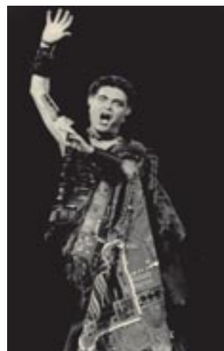
Ένας αυταρχικός γένης, ο Αίγισθος (Σοφοκλής, Ηλέκτρα, Στ. Κυριακίδης, Εθν. Θέατρο, 1996, σκην. Λ. Κονιόρδου)