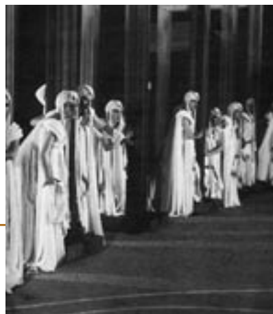
Χορός της Ελένης (Αμφιθέατρο, 1999, σκην. Σ. Ευαγγελιάτος)